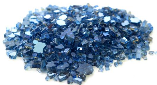
CRISTAL AZUL CALVERT

OBS: ** Todos os produtos constantes deste catálogo estão sujeitos à disponibilidade em estoque. Os modelos são renovados periodicamente. As referências apresentadas representam as matérias primas, medidas, cores e acabamentos utilizados em todos os produtos, havendo, contudo, a possibilidade de pequenas variações de tamanho e cor. Todas as fotos do catálogo possuem caráter meramente ilustrativo.