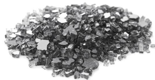
CRISTAL CINZA ÔNIX