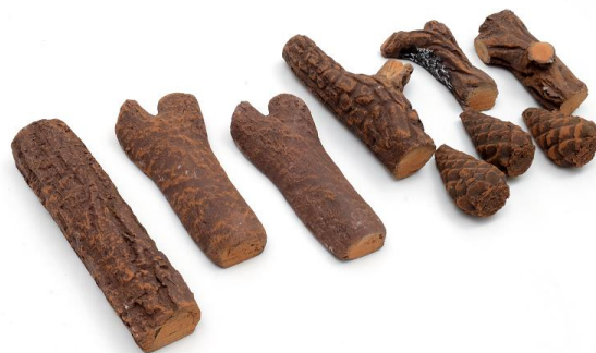
LENHO CERÂMICO 9 PEÇAS