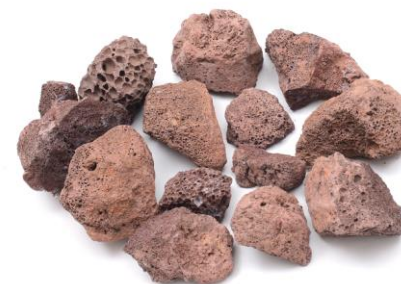
PEDRA VULCÂNICA MARROM