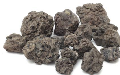
PEDRA VULCÂNICA PRETA