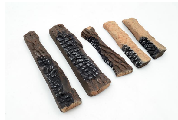
LENHO CERÂMICO 5 PEÇAS